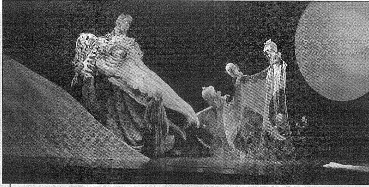
Théâtre Dame de cœur

Bien que la programmation du 11 e Festival international des arts de la marionnette s'annonce des plus relevées, le spectacle Harmonie mérite une attention toute spéciale, selon les organisateurs de l'événement. Et pour cause, 48 enfants manipuleront les marionnettes géantes au cours de trois représentations.