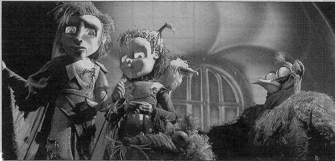
Théâtre Dame de cœur

Shin a besoin d'énergie, car il a tendance à croire que son travail ne sert à rien devant l'ampleur de la tâche, énergie que leur donneront les marionnettes manipu-